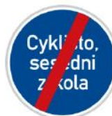
Konec jiného příkazu

Můžeme se setkat také se značkou s nějakým nápisem. Ten určuje, co máme udělat. V tomto případě sesednout a vést kolo.