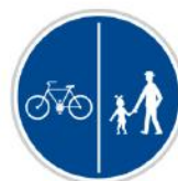
Oddělená stezka pro chodce a cyklisty

Za touto značkou už mohou zase jezdit auta nebo chodit chodci, stezka pro chodce a cyklisty končí.