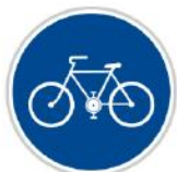
Stezka pro cyklisty

Touto značkou je označen úsek cesty vyhrazený pouze cyklistům.