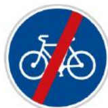
Konec stezky pro cyklisty

Touto značkou je označen úsek cesty vyhrazený pouze cyklistům.