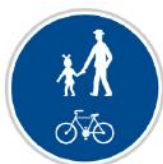
Stezka pro chodce a cyklisty

Za touto značkou už mohou zase jezdit auta nebo chodit chodci, stezka pro cyklisty končí.