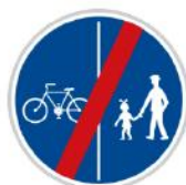
Konec oddělené stezky pro chodce a cyklisty

Stejná značka jako předchozí, s tím rozdílem, že část pro chodce a část pro ostatní je oddělena barou nebo jiným barevným povrchem.