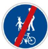
Konec stezky pro chodce a cyklisty

Za touto značkou už mohou zase jezdit auta nebo chodit chodci, stezka pro chodce a cyklisty končí.