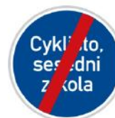
Konec jiného příkazu

Můžeme se setkat také se značkou s nějakým nápisem. Ten určuje, co máme udělat. V tomto případě sesednout a vést kolo.