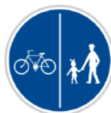
Oddělená stezka pro chodce a cyklisty

Za touto značkou už mohou zase jezdit auta nebo chodit chodci, stezka pro chodce a cyklisty končí.