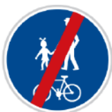
Konec stezky pro chodce a cyklisty

Za touto značkou už mohou zase jezdit auta nebo chodit chodci, stezka pro chodce a cyklisty končí.