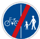
Konec oddělené stezky pro chodce a cyklisty

Stejná značka jako předchozí, s tím rozdílem, že část pro chodce a část pro ostatní je oddělena čarou nebo jiným barevným povrchem.