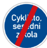
Konec jiného příkazu

Můžeme se setkat také se značkou s nějakým nápisem. Ten určuje, co máme udělat. V tomto případě sesednout a vést kolo.