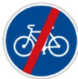
Konec stezky pro cyklisty

Touto značkou je označen úsek cesty vyhrazený pouze cyklistům.