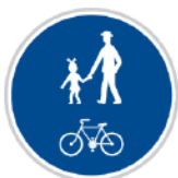
Stezka pro chodce a cyklisty

Za touto značkou už mohou zase jezdit auta nebo chodit chodci, stezka pro cyklisty končí.