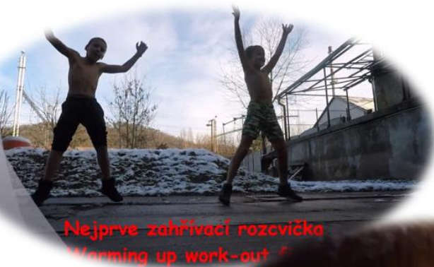
Nejprve zahřívací rozvíčka Warming up work-out

Náš nejnovější kroužek, který vzešel ze žádostí dětí - „youtuberů“. Cílem kroužku je jednak natáčet videa zaměřená na dětského diváka na youtube, naučit děti práci s kamerou, úpravy videí, práci s fotoaparátem, úpravu fotografie, ale také autorský zákon, problematika kyberšikany či bezpečnosti na internetu.