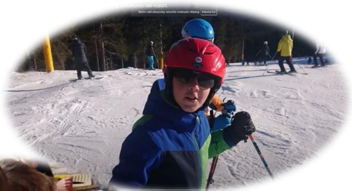
In this freezing video ...